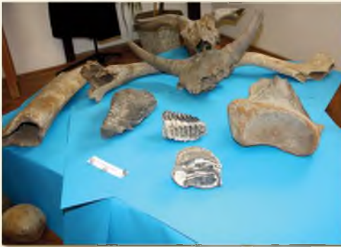
Ősmaradványok a hartai sóderágyból