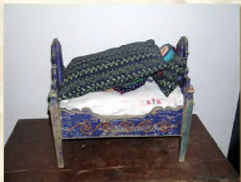
Az ágyterítő, és egykor az, ágynemű huzata is kékfestő volt.

Pad veszi körül a négyszögletes kemencét is, ahol főleg gyerekek és öregek melegedtek. Mellette a falon törülköző- és szépen kivarrt fűsű- és kefetartó.