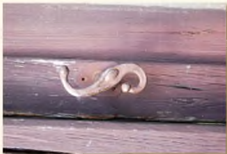
A bejárati kisajtó mives kilincse helyi mesterek munkája.

A fehérre meszelt ház utcafrontjára kis ablak nyílik. Deszkakerítés köti össze a szomszéd házzal, melyet egyszerű oszlopok tagolnak.