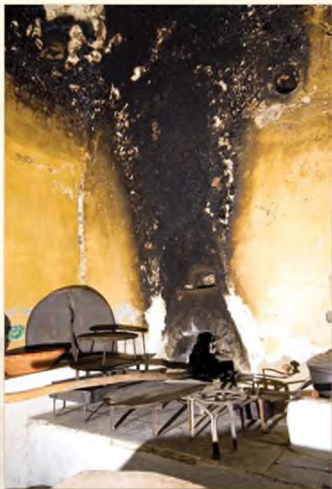
A kemence füstjéből kicsapódó kátrány a boltzotat fényes feketére színezte, és idővel eltakarta az eredetileg világoskék, mintás falat.

A konyhából nyíló kamra ( khamr ) és az abból nyíló spejz ma az iskolai látogatócsoporthoz kedvenc bemutatótere. Itt láthatóak a kétkezi paraszti munka világának eszközei, mérő- és tárolóedényei, valamint a házépítés szerszámai. A kenyérdagasztó teknő és a kézi hajtású mosógép között százéves bodzaprés látható, mely a gyógyító lekvárfőzés újratertett hagyományának, a Bodzaünnepnek a jelképtárgya.