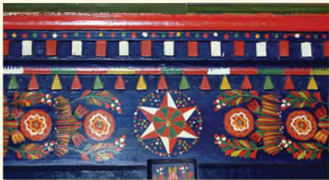
A hartai bútorfestészet sajátja az egyedi stílizálású szegfű- és rózsamotívum, és a legyezőkké rendeződött, egymásra tornyosuló vonalkák.

A ház másik bejárata a konyhába nyílik, amelyre egy díszes lécajtó is fel volt szerelve. Amikor süttöttek főztek, általában csak ezt tették be, hogy a háziállatok be ne jöjjenek. A tejfeldolgozás gang alatt kezdődő munkatere és a köcsögállvány ( milichstits ) a konyhaközeli udvarrészen volt.