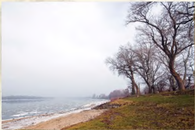
A Duna legnagyobb alföldi kanyarulatánál...

A Duna árterülete a folyószabályozások előtt a magyar Alföld virágzó, változatos tája volt. Sóderbányászás közben számos ősi csontlelet őstulok-, szarvas- és mamutcsont került elő a Dunából. Régészeti leletanyagok sokasága bizonyítja, hogy az erekkel, fokokkal, időszakos vízjárásokkal szabdalt, termékeny öntéstalajú árvízmentes háta, partok az