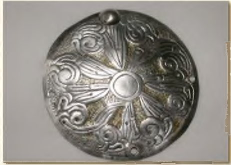
... és a leggazdagabb női sír egyik hajfonatkorongja