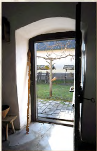
A sokféle tejet és tejterméket termelő hartaiakról Fél Edűt ezt írja: „... a juhtej és termékeinek gyakori fogyasztása megkülönbözteti Hartát a szomszédos faluktól.”

A kéményaljában három oldalon agyagpadkát alakítottak ki. Itt mindkét oldalon szabadtűzön vagy az innen nyíló, kender- és kukoricaszárral fűtött sárkemencében ( kschmeerteoove ) főzték a krumpéresup -ot, a krumplilevest és süttötték a kriivekuchá -t, a szalonnás lepényt.