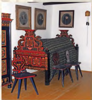
A festett láda elmaradozott a 20. századi szobából. A Tájházban lévő 1865-ös menyasszonyi láda a gyűjtemény legrégebbi dátumú festett bútora.

Szokás volt Hartán is az ágyak magasra ágyazása, de itt nem az ágynemű sokaságával, inkább az ágyfenék szalmával való kitömésével érték el ezt. Az ágyak fölött a 20. század első felétől a család tagjairól készült nagyalakú fényképek lógtak. Az ágy mellett phichrschenkletje (könyves szekrényke) és kis falióra.