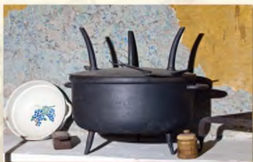
A vas főzőedények egy részét a hajósok hozták a Felduna vidékéről. Ezek leglátványosabbika a raejndl, amihez egy ugyancsak háromlábú fedőtepsi tartozott. A kétágú rövidnyelű villa a hús forgatására szolgált.

A konyhából nyíló kamra ( khamr ) és az abból nyíló spejz ma az iskolai látogatócsoporthoz kedvenc bemutatótere. Itt láthatóak a kétkezi paraszti munka világának eszközei, mérő- és tárolóedényei, valamint a házépítés szerszámai. A kenyérdagasztó teknő és a kézi hajtású mosógép között százéves bodzaprés látható, mely a gyógyító lekvárfőzés újratertett hagyományának, a Bodzaünnepnek a jelképtárgya.