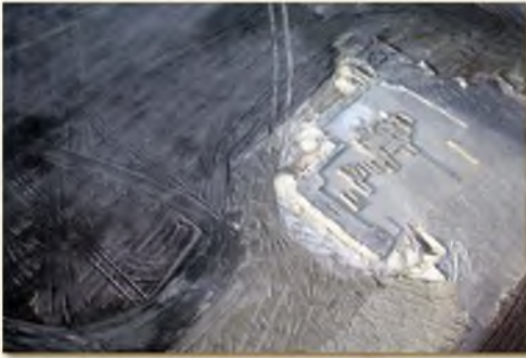
A freifelti honfoglalás kori temető madártávlatból...